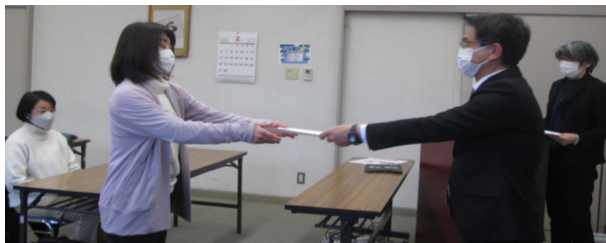
2月5日 要約筆記者養成講習会 修了式